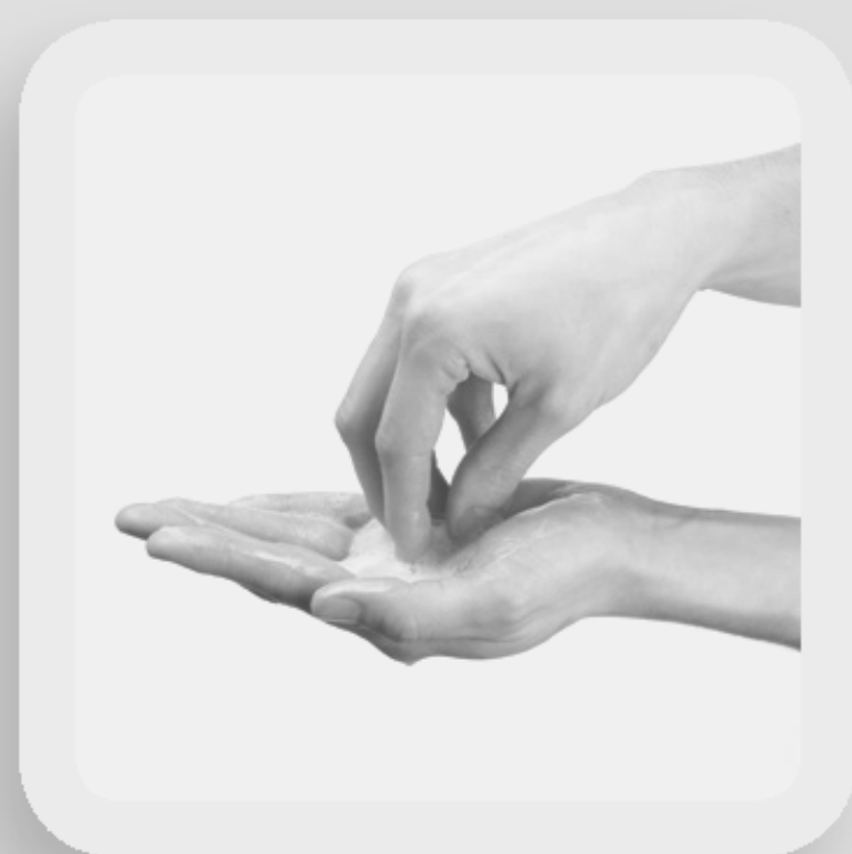
4 NETTOYER LES ONGLES